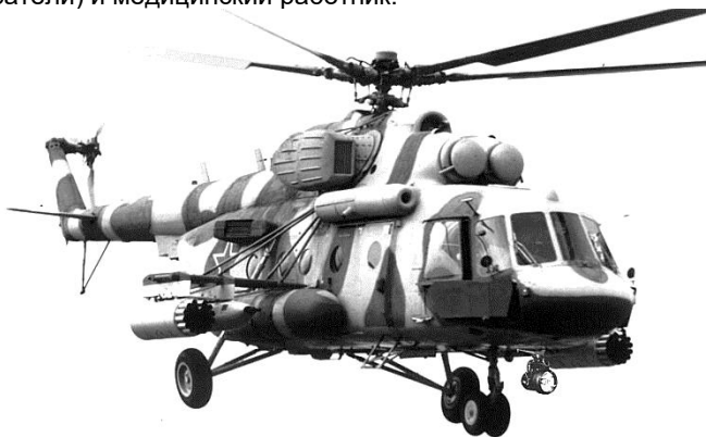
Рис. 0.1. Общий вид вертолета Ми-8МТВ-5-1

При выполнении спасательных работ в состав экипажа могут включаться спасатель (спасатели) и медицинский работник.